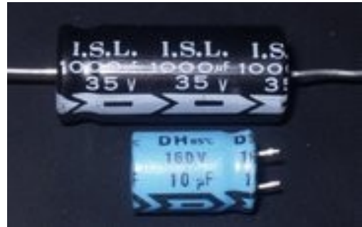
Figura 2: Capacitores Eletrolíticos

Uma característica importante dos capacitores eletrolíticos é que, quase sempre, eles apresentam polaridade. Se esta polaridade for invertida o capacitor corre o risco de explodir ou, pelo menos, ser irremediavelmente danificado. Sempre observe na cobertura do capacitor a indicação da polaridade antes de ligar o circuito.