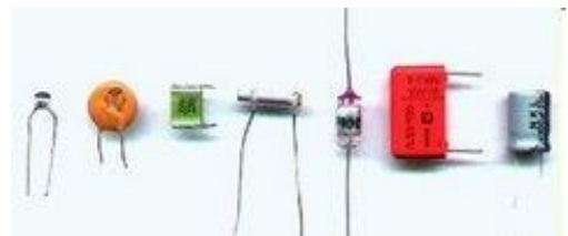
Figura 1: Alguns tipos de capacitores

Além da própria capacitância, um parâmetro importante é a tensão elétrica máxima que o capacitor suporta. Esta tensão pode variar de milhares de volts para capacitores cerâmicos até alguns poucos volts para capacitores eletrolíticos. Se esta tensão for ultrapassada o capacitor pode ser destruído chegando mesmo a explodir.