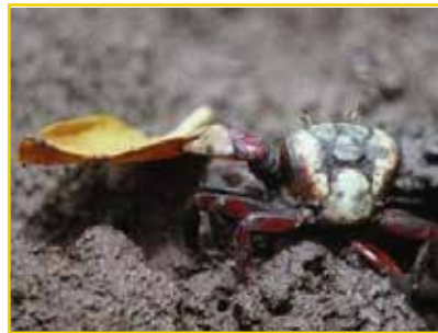
CARANGUEJO-UÇÁ Ucides cordatus