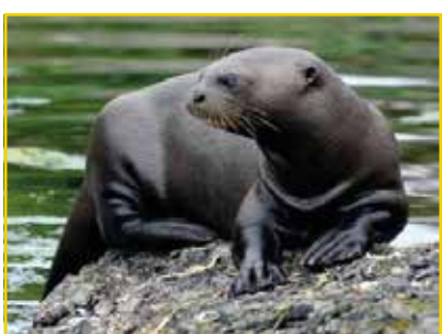
ARIRANHA Pteronura brasiliensis