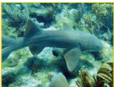
TUBARÃO-LIXA Ginglymostoma cirratum