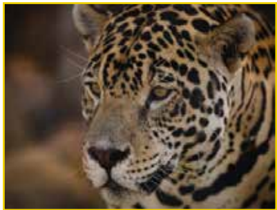
ONÇA-PINTADA Panthera onca