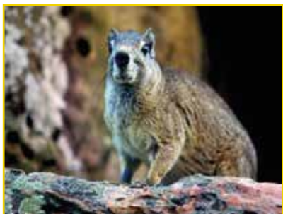
MOCÓ Kerodon rupestris