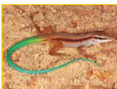
CALANGO-DE-CAUDA-VERDE Ameivula venetacaudus