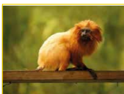
MICO-LEÃO-DOURADO Leontopithecus rosalia