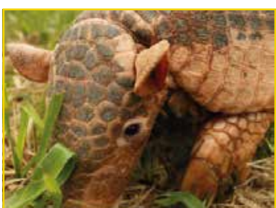
TATU-CANASTRA Priodontes maximus