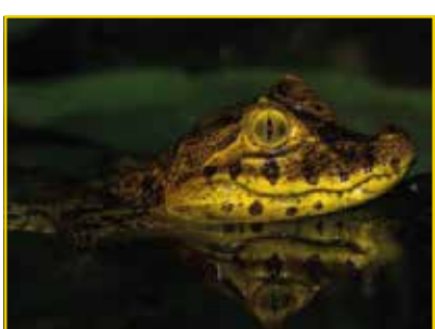
JACARÉ-DE-PAPO-AMARELO Caiman latirostris