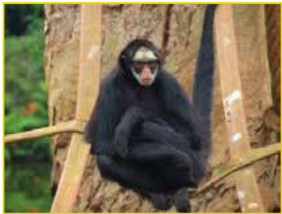
MACACO-ARANHA-DA-TESTA-BRANCA Ateles marginatus