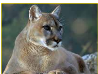
ONÇA-PARDA Puma concolor