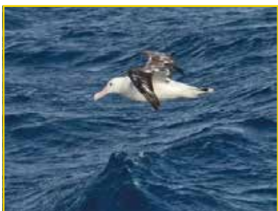
ALBATROZ-ERRANTE Diomedea exulans