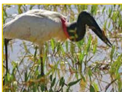
TUIUIÚ/JABURU Jabiru mycteria