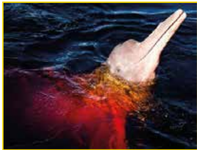
BOTO-COR-DE-ROSA Inia geoffrensis