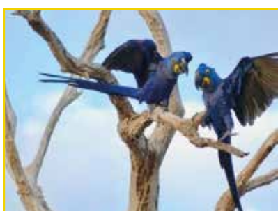
ARARA-AZUL Anodorhynchus hyacinthinus