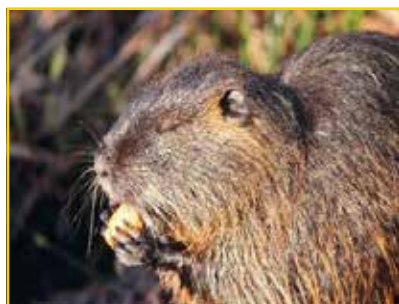
RATÃO-DO-BANHADO Myocastor coypus