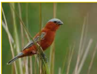
CABOCLINHO-DO-CHAPÉU-CINZENTO Sporophila cinnamomea