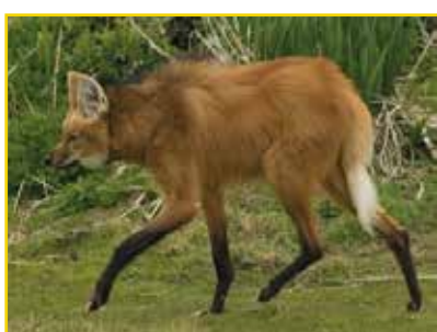
LOBO-GUARÁ Chrysocyon brachyurus