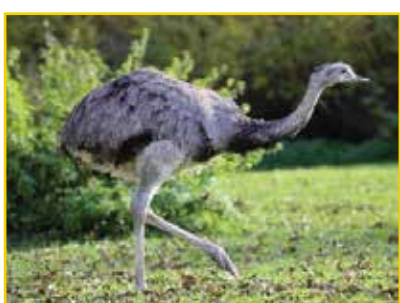
EMA Rhea americana